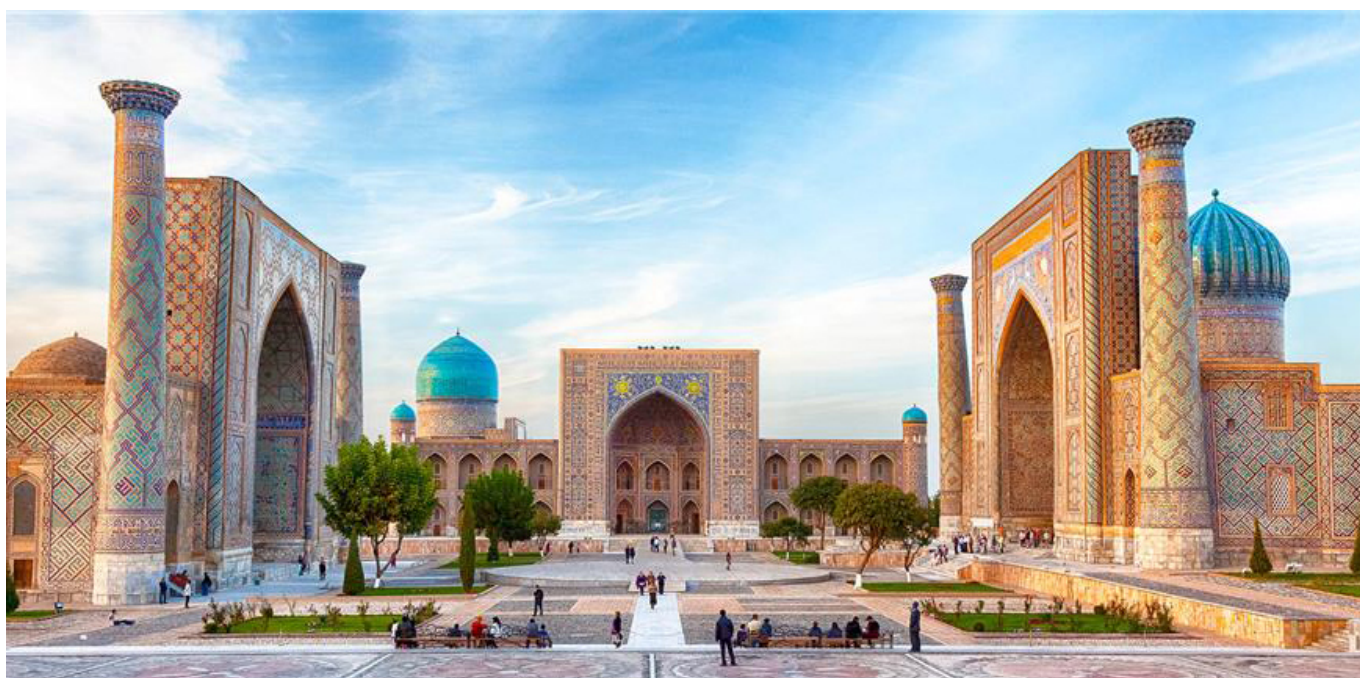
Самарканд. Площадь Регистан.

Примерно в это же время от эпидемии гибнут его родители. Омар продает мастерскую, собирает свои вещи и покидает отцовский дом отправившись в Самарканд.