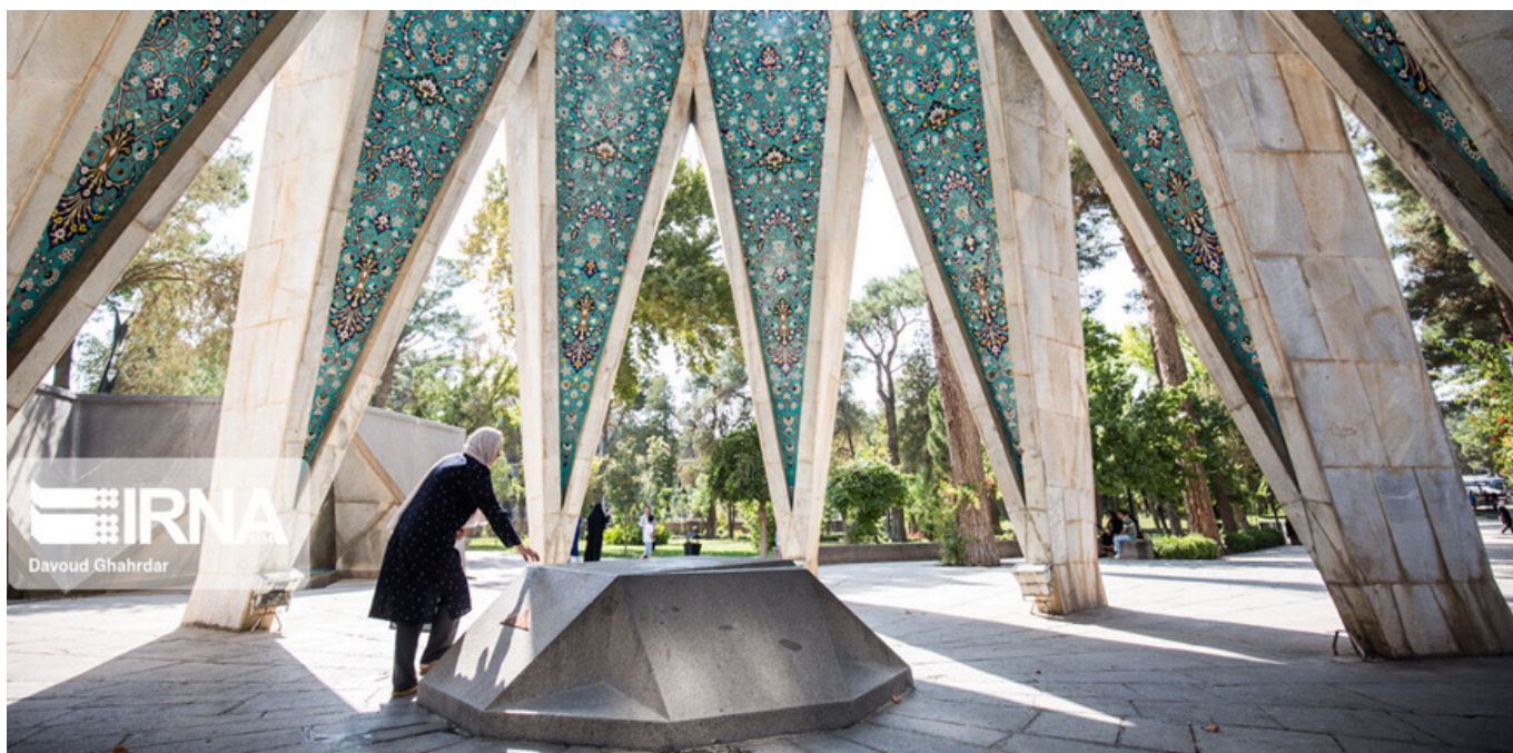
Гробница Омара Хайяма в Нишапуре.

С этими словами на устах Хайям умер. Насколько блестяща смерть воина погибшего на пути Всевышнего, настолько благородна смерть ученого, погибшего на пути познания Аллаха.