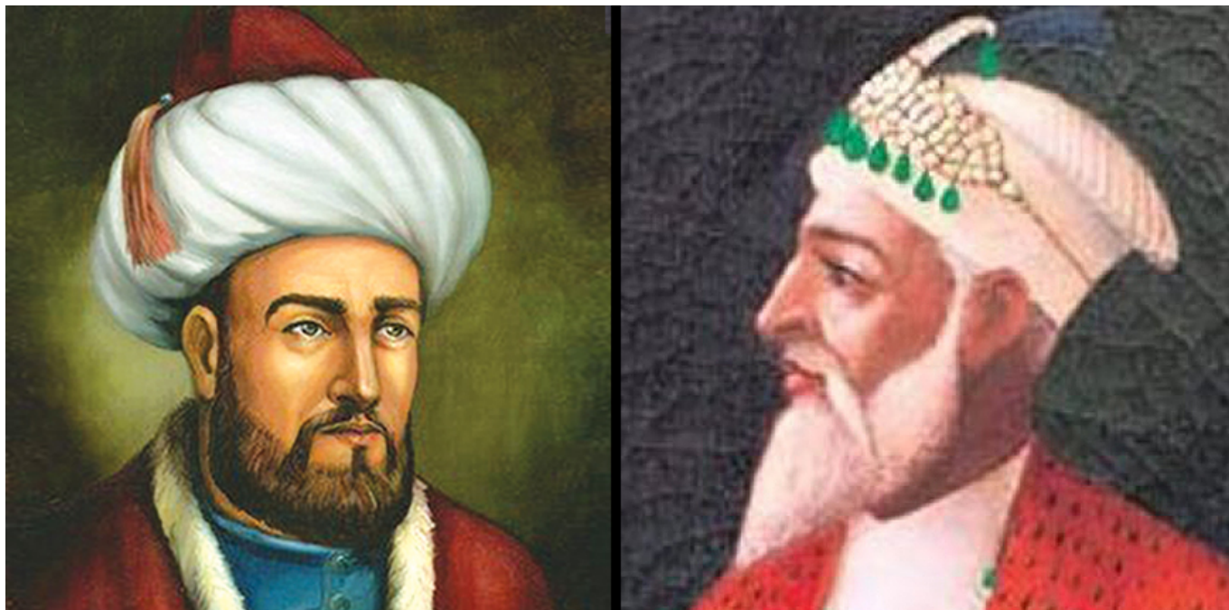
Малик-шах (справа) и Низам аль-Мульк (слева) в представлении художников.

Именно здесь, Омар Хайям разрабатывает самый точный в мире календарь, который на 7 секунд точнее Григорианского и до настоящего времени, действует в Иране в качестве официального с 1079 года.