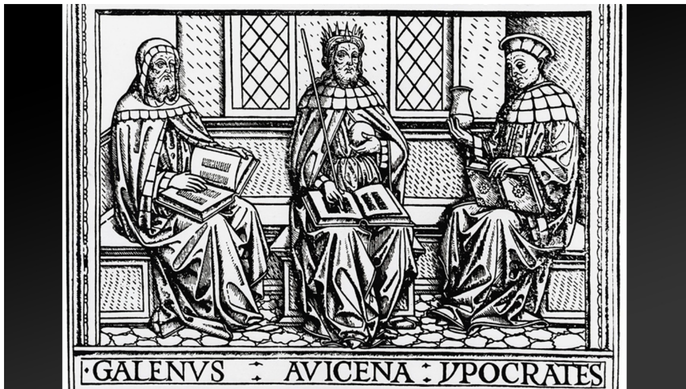
Ибн Сина с королевскими атрибутами в окружении Галена и Гиппократата

Ибн Сина (Абу Али Хусейн ибн Сина) известный на западе под именем Авицена - ученый-универсал, философ, врач, поэт, музыкант, духовный наставник, родился в 980 году в городе Афшан (недалеко от Бухары) в семье богатой и образованной. Увлекающийся наукой и философией отец Ибн Сины, по профессии сборщик налогов, через некоторое время, получает повышение в Бухару и вся семья переезжает в город, который, при Саманидах являлся средоточием высокой культуры и науки. Уже в возрасте 5 лет Ибн Сина проявляет тягу к обучению и обнаруживает исключительную память. В возрасте 10 лет он становится хафизом, т.е. знает наизусть весь Коран. Затем он изучает фикх, где является самым младшим из слушателей, однако, даже взрослые советуются с ним по вопросам исламского права, несмотря на его юный возраст (12 лет).